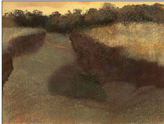
Edgar Degas - A Floresta