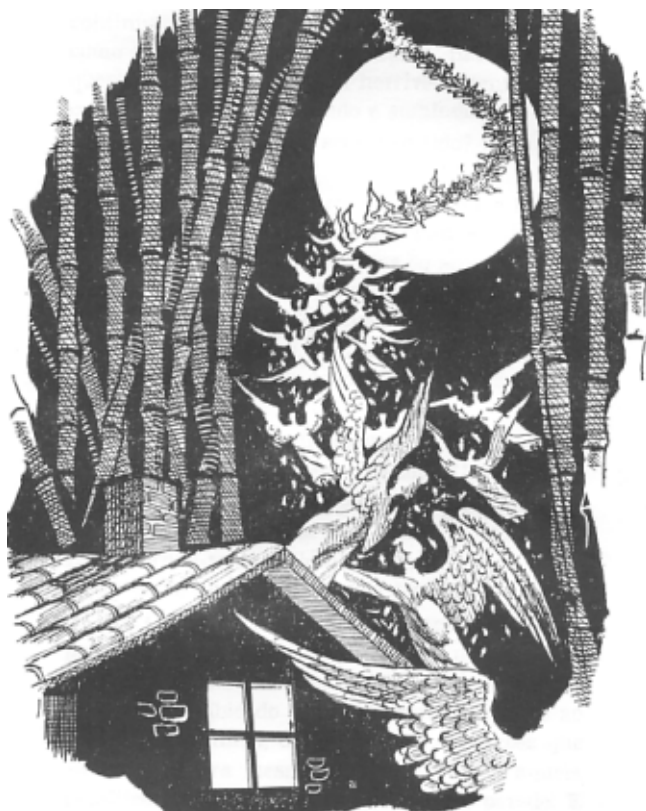
Os anjos subiram em revoada, do bambual à Lua, uma Lua de luar.

Nhô João Cafundó não era homem de muita prosa. Criado no trato da terra, vivia na cidade em casa de chão de terra batida e coberta de telha vã. Alto e forte, apesar da idade, com sua barba rala de caipira paulista, cigarrão de fumo de corda e palha de milho, detestava prosápia de gente citadina, não aceitava latinório de padre nem mandingas de preto e caboclo. Mas estava na porta de sua casa, descalço, espiando a noite, quando viu aquele despropósito de asas brancas no céu. Curioso, atravessou a rua e foi conversar com Zé Luís. Chegou desconfiado, cumprimentou a turma e perguntou: