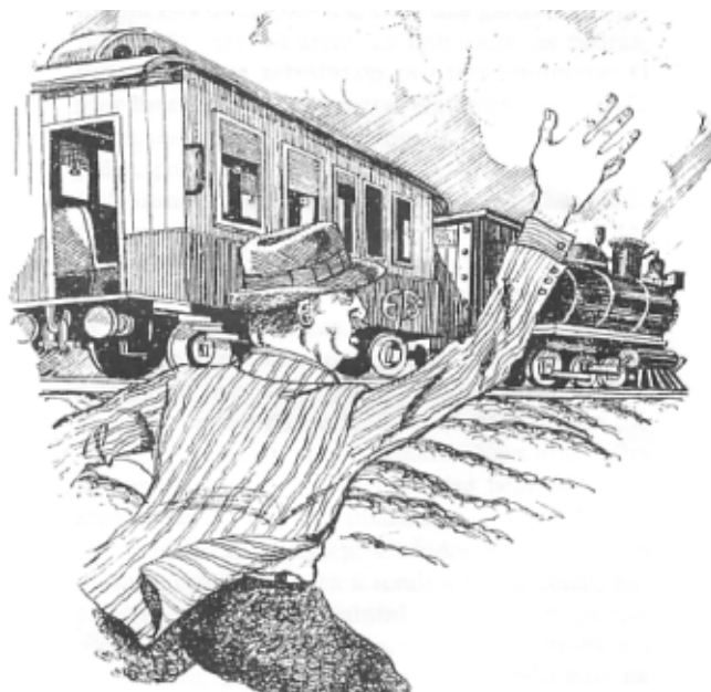
O trem da Sorocabana devorava o chão com dentes de aço.