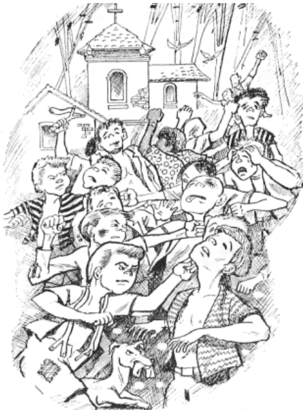
A guerrinha de Tróia fez cantar muitos galos.

às suas casas, onde os pais e as mães faziam interrogatórios enérgicos e aplicavam o corretivo de cintas, chineladas e palmadas nos dois exércitos.