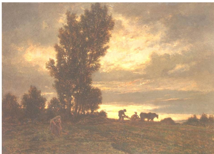
Théodore Rousseau O Campo